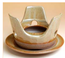
105027 コンロセット 2 6 2 5 円 (本体価格 2 5 0 0 円) (台皿付: 径 13.8×高さ 8.5cm) (台皿なし: 径 11.5×高さ 7.8cm)