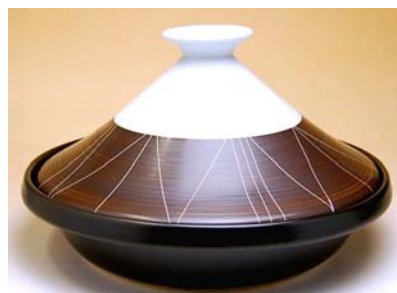
186016 茶彩模様(尺)タジン鍋 (3～4人用) 1 7 8 5 0 円 (本体価格 1 7 0 0 0 円) (蓋付：径 29.5×高さ 17.2cm) (蓋なし：径 29.5×高さ 6.8cm)