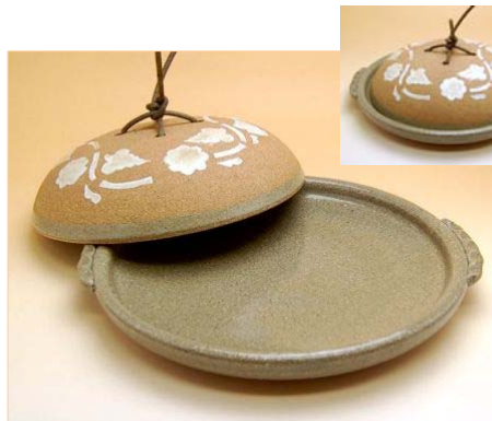
平兵衛 350008 9寸蓋付陶板 10080円(本体価格 9600円) (蓋付: 径27.5×高さ8cm) (蓋なし: 径27.5×高さ3.8cm) 350022 11寸蓋付陶板 17325円(本体価格 16500円) (蓋付: 径33×高さ8.5cm) (蓋なし: 径33×高さ3.8cm)