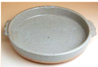
平兵衛 350016 7寸料理鍋 2625円(本体価格 2500円) (径21×高さ4cm) 350017 9寸料理鍋 6720円(本体価格 6400円) (径27.6×高さ3.7cm) 350018 11寸料理鍋 10500円(本体価格 10000円) (径32.3×高さ5cm)