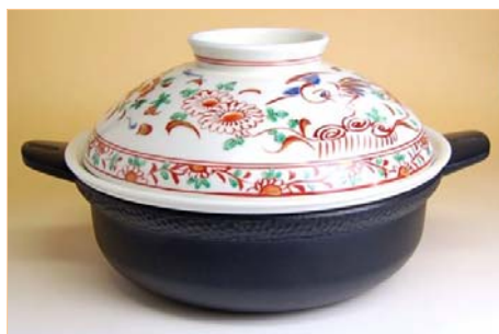
129057 錦万暦花鳥 31cm I-H 鍋 (4~5人用) 52500円 (本体価格 50000円) (蓋付: 径 31.2×高さ 19.5cm) (蓋なし: 径 31.2×高さ 10.5cm)