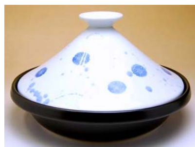
186017 染付模様(尺)タジン鍋 (3～4人用) 1 7 8 5 0 円 (本体価格 1 7 0 0 0 円) (蓋付：径 29.5×高さ 17.2cm) (蓋なし：径 29.5×高さ 6.8cm)