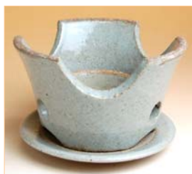
350013 平兵衛 (中) コンロセット 2 3 1 0 円 (本体価格 2 2 0 0 円) (台皿付: 径 12×8.5cm) (台皿なし: 径 12×7.3cm)