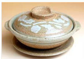
350001 唐草 目玉焼き 1 4 0 7 円 (本体価格 1 3 4 0 円) (蓋皿付: 径 11.6×高さ 6.5cm) (蓋皿なし: 径 11.6×高さ 3.7cm)