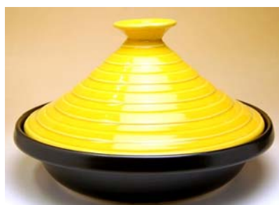
186018 黄釉彩(尺)タジン鍋 (3～4人用) 1 7 8 5 0 円 (本体価格 1 7 0 0 0 円) (蓋付：径 29.5×高さ 17.2cm) (蓋なし：径 29.5×高さ 6.8cm)