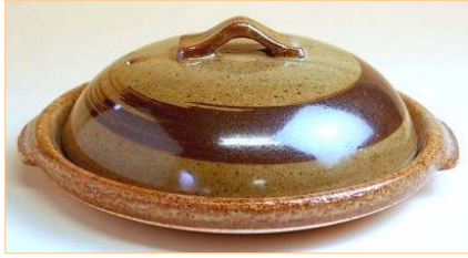
105038 6.5寸つまみ付蓋付陶板 3360円(本体価格 3200円) (蓋付: 径19×高さ7cm) (蓋なし: 径19×高さ2.8cm)