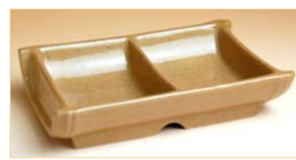
105030 竹型二品葉味入れ 1 7 2 2 円 (本体価格 1 6 4 0 円) (径 14.6×幅 9×高さ 3.5cm)