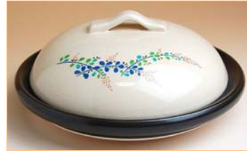
105021 萩 5.5寸蓋付陶板 4410円(本体価格 4200円) (蓋付: 径17×高さ7.5cm) (蓋なし: 径17×高さ3.2cm)