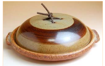
安楽 105009 7寸蓋付陶板 3843円(本体価格 3660円) (蓋付: 径21.6×高さ6cm) (蓋なし: 径21.6×高さ2.7cm) 105010 9寸蓋付陶板 11970円(本体価格 11400円) (蓋付: 径28.3×高さ8.3cm) (蓋なし: 径28.3×高さ3.3cm) 105034 11寸蓋付陶板 18375円(本体価格 17500円) (蓋付: 径33.4×高さ9.5cm) (蓋なし: 径33.4×高さ4.8cm)