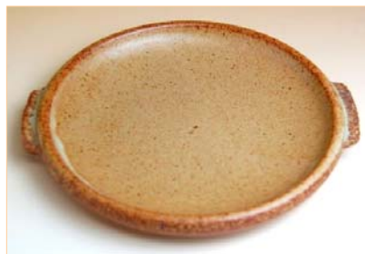
安楽 105035 6.5寸陶板 1680円(本体価格 1600円) (径19×高さ2.7cm) 105036 7寸陶板 1953円(本体価格 1860円) (径21.6×高さ2.7cm) 105037 9寸陶板 6300円(本体価格 6000円) (径28.3×高さ3cm) 105026 11寸陶板 9975円(本体価格 9500円) (径33.4×高さ4.8cm)