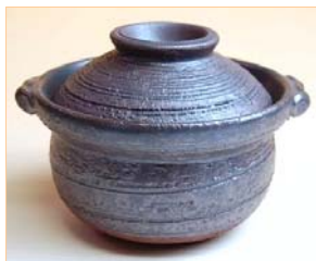
105024 黒 4.5 寸手造り深鍋 4 2 0 0 円 (本体価格 4 0 0 0 円) (径 13.1×高さ 10cm)