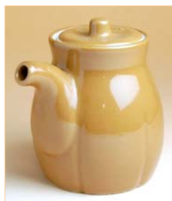
105028 ポンズ入れ 3 1 5 0 円 (本体価格 3 0 0 0 円) (容量: 510ml) (口径 7.5×高さ 12.5cm)