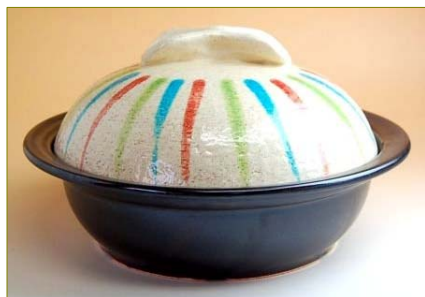
105039 おぼろ十草 30cm I-H 鍋 (3人用) 26250円 (本体価格 25000円) (蓋付: 径 30×高さ 16.5cm) (蓋なし: 径 30×高さ 8.8cm)