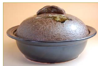
105041 唐津流し 27cm I-H 鍋 (2人用) 22050円 (本体価格 21000円) (蓋付: 径 26.7×高さ 15cm) (蓋なし: 径 26.7×高さ 7.4cm)