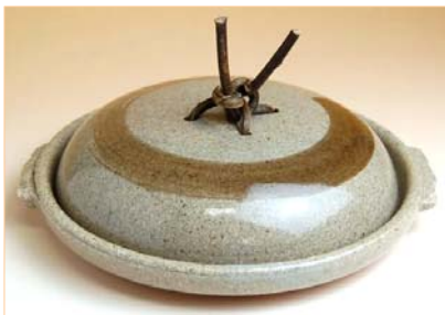
平兵衛 350006 6.2寸蓋付陶板 3255円(本体価格 3100円) (蓋付: 径18×高さ5cm) (蓋なし: 径18×高さ2.5cm) 350007 7寸蓋付陶板 4200円(本体価格 4000円) (蓋付: 径21×高さ6.2cm) (蓋なし: 径21×高さ2.6cm)