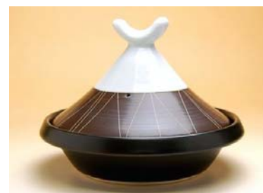
186011 茶彩模様 (小) タジン鍋 (1～2人用) 5 7 7 5 円 (本体価格 5 5 0 0 円) (蓋付：径 21×高さ 16cm) (蓋なし：径 21×高さ 5.8cm)