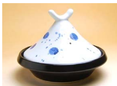
186012 染付模様 (小) タジン鍋 (1～2人用) 5 7 7 5 円 (本体価格 5 5 0 0 円) (蓋付：径 21×高さ 16cm) (蓋なし：径 21×高さ 5.8cm)