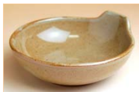
105029 手付とんすい 1 1 5 5 円 (本体価格 1 1 0 0 円) (径 12.2×高さ 4.8cm)