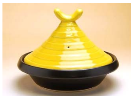
186010 黄釉彩 (小) タジン鍋 (1～2人用) 5 7 7 5 円 (本体価格 5 5 0 0 円) (蓋付：径 21×高さ 16cm) (蓋なし：径 21×高さ 5.8cm)