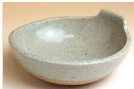
350012 平兵衛 手付とんすい 9 4 5 円 (本体価格 9 0 0 円) (径 12.2×5cm)