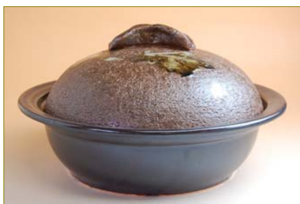
105040 唐津流し 30cm I-H 鍋 (3人用) 26250円 (本体価格 25000円) (蓋付: 径 30×高さ 16.5cm) (蓋なし: 径 30×高さ 8.8cm)