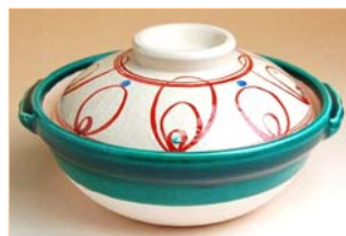
105020 四方丸紋グリーン交趾 5 寸土鍋 5 0 4 0 円 (本体価格 4 8 0 0 円) (蓋付: 径 15.2×高さ 8.5cm) (蓋なし: 径 15.2×高さ 5.5cm)