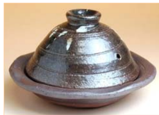
105025 黒オリベ 蓋付深陶板 3 8 8 5 円 (本体価格 3 7 0 0 円) (径 16×高さ 9cm)