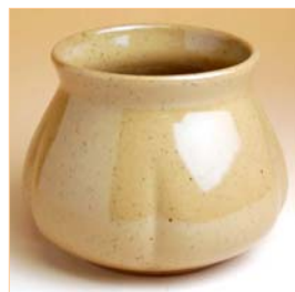
105031 ガラ入れ 2 3 1 0 円 (本体価格 2 2 0 0 円) (口径 9.4×高さ 9.7cm) (胴径 12.5×高さ 9.7cm)