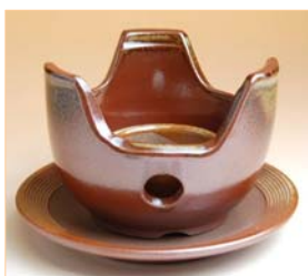
105023 伊良保 コンロセット 2 7 3 0 円 (本体価格 2 6 0 0 円) (台皿付: 径 14.3×高さ 9cm) (台皿なし: 径 11×高さ 8cm)