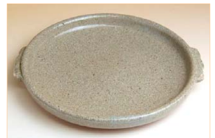
平兵衛 350023 6.2寸陶板 1512円(本体価格 1440円) (径18.6×高さ2.5cm) 350024 7寸陶板 1995円(本体価格 1900円) (径21×高さ2.6cm) 350010 9寸陶板 4830円(本体価格 4600円) (径27×高さ3.5cm) 350011 11寸陶板 8610円(本体価格 8200円) (径32.3×高さ4cm)