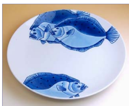
201020 ひらめ 10寸平皿 13650円 (径30.5×高さ4cm) (本体価格 13000円)