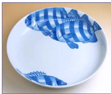
201023 石鯛 9寸鉦鉢 1 3 6 5 0 円 (径 27×高さ 6cm) (本体価格 1 3 0 0 0 円)