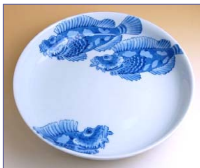
201028 おにおこぜ 9寸鉦鉢 2 1 0 0 0 円 (径 27×高さ 6cm) (本体価格 2 0 0 0 0 円)