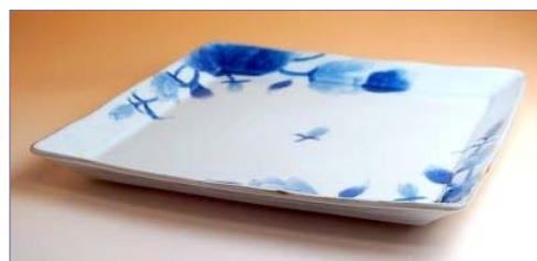
149014 こもれび 角盛皿 5 2 5 0 円 (本体価格 5 0 0 0 円) (径 28.5cm 角)