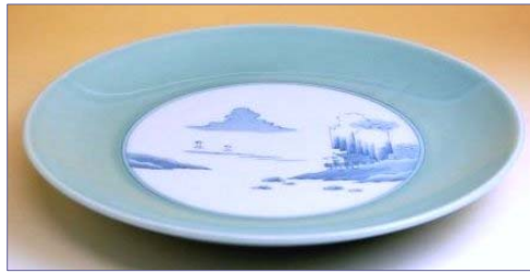
青磁中山水 201090 10寸 平皿 (径 30cm) 6 8 2 5 円 (本体価格 6 5 0 0 円) 201091 12寸 平皿 (径 35.8cm) 1 2 9 1 5 円 (本体価格 1 2 3 0 0 円) 201092 13寸 平皿 (径 39cm) 1 8 9 0 0 円 (本体価格 1 8 0 0 0 円) 201093 15寸 平皿 (径 45cm) 3 0 4 5 0 円 (本体価格 2 9 0 0 0 円)