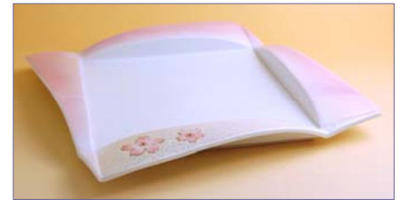
164060 桜虹彩 紙合わせ型盛皿 6 8 2 5 円 (本体価格 6 5 0 0 円) (径 23 角×高さ 2.3cm)