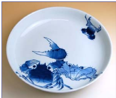
201022 かに 9寸鉦鉢 1 3 6 5 0 円 (径 27×高さ 6cm) (本体価格 1 3 0 0 0 円)