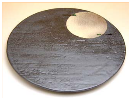
161081 満月 丸盛皿 9 4 5 0 円 (本体価格 9 0 0 0 円) (径 27×高さ 1.8cm)