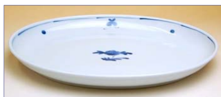
165125 小花 27cm 大皿 3 1 5 0 円 (本体価格 3 0 0 0 円) (径 27.3×19.4×高さ 2.8cm)