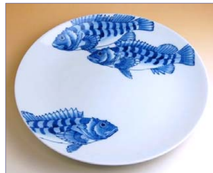
201014 かさご 10寸平皿 13650円 (径30.5×高さ4cm) (本体価格 13000円)