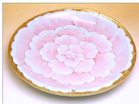
192065 金濃ピンク牡丹 尺皿 1 0 5 0 0 円 (本体価格 1 0 0 0 0 円) (径 30×高さ 5.1cm)