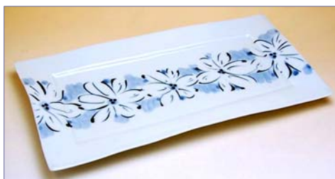
227018 花紋帯 長角皿 (大) 5 2 5 0 円 (本体価格 5 0 0 0 円) (径 32.5×17.3×高さ 2cm)