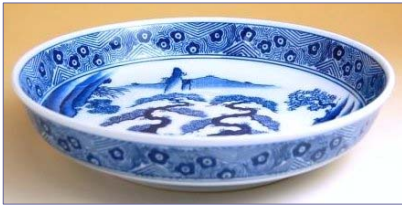
山水 201101 7寸鉦鉢 (径 21cm) 3 4 6 5 円 (本体価格 3 3 0 0 円) 201102 8寸鉦鉢 (径 24.5cm) 3 9 9 0 円 (本体価格 3 8 0 0 円) 201103 9寸鉦鉢 (径 27.3cm) 5 7 7 5 円 (本体価格 5 5 0 0 円)