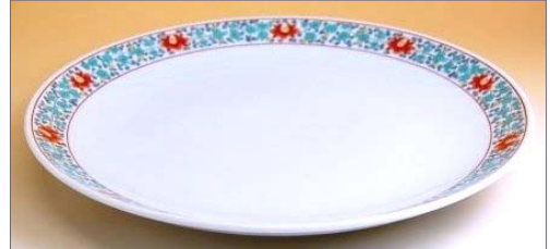
錦花唐草 201094 10寸 平皿 (径 30cm) 8 9 2 5 円 (本体価格 8 5 0 0 円) 201095 12寸 平皿 (径 35.8cm) 1 5 7 5 0 円 (本体価格 1 5 0 0 0 円) 201096 13寸 平皿 (径 39cm) 2 2 5 7 5 円 (本体価格 2 1 5 0 0 円) 201097 15寸 平皿 (径 45cm) 3 3 6 0 0 円 (本体価格 3 2 0 0 0 円)