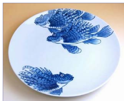
201017 みのかさご 10寸平皿 19950円 (径30.5×高さ4cm) (本体価格 19000円)