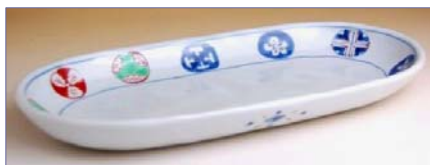
187016 染錦丸紋 小判皿 (大) 6 5 1 0 円 (本体価格 6 2 0 0 円) (径 13×26.9×高さ 3cm)