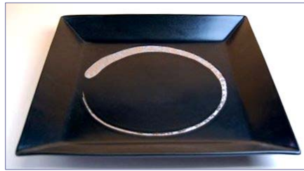
149048 黒プラチナ刷毛 額縁尺皿 8 4 0 0 円 (本体価格 8 0 0 0 円) (径 29.2×高さ 3.8cm)