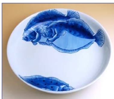
201029 ひらめ 9寸鉦鉢 1 3 6 5 0 円 (径 27×高さ 6cm) (本体価格 1 3 0 0 0 円)