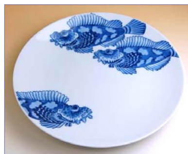
201021 おにおこぜ 10寸平皿 19950円 (径30.5×高さ4cm) (本体価格 19000円)