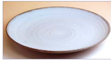
165014 唐津粉引 尺皿 1 0 5 0 0 円 (本体価格 1 0 0 0 0 円) (径 30.5×高さ 4cm)