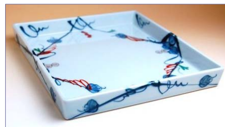
317001 染錦ぶどう 角盛皿 7 3 5 0 円 (本体価格 7 0 0 0 円) (径 23.2×24.6×高さ 3cm)