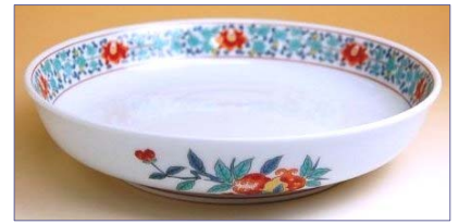
錦花唐草 201098 7寸鉦鉢 (径 21cm) 4 8 3 0 円 (本体価格 4 6 0 0 円) 201099 8寸鉦鉢 (径 24.5cm) 5 4 6 0 円 (本体価格 5 2 0 0 円) 201100 9寸鉦鉢 (径 27.3cm) 7 8 7 5 円 (本体価格 7 5 0 0 円)