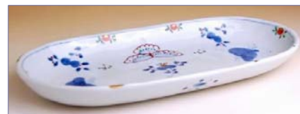
187009 天啓花蝶 小判皿 (大) 7 8 7 5 円 (本体価格 7 5 0 0 円) (径 13×26.9×高さ 3cm)