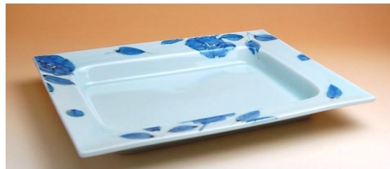
117041 染付バラ 揚げ物プレート (金網なし) 6 3 0 0 円 (径 28.5×21.5×高さ 3.4cm) (本体価格 6 0 0 0 円)