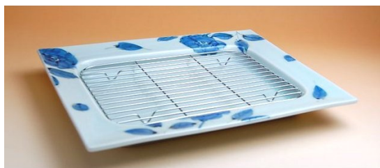
117040 染付バラ 揚げ物プレート (金網付) 8 4 0 0 円 (径 28.5×21.5×高さ 3.4cm) (本体価格 8 0 0 0 円)