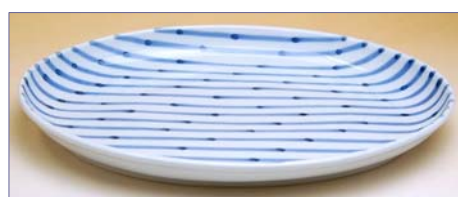
165126 濃十草 27cm 大皿 4 2 0 0 円 (本体価格 4 0 0 0 円) (径 27.3×19.4×高さ 2.8cm)