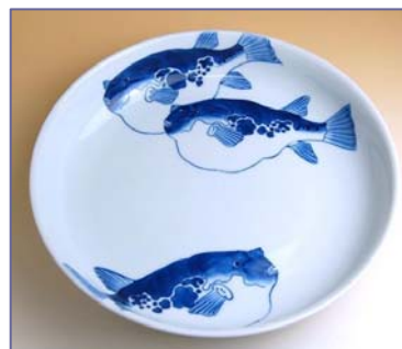
201031 ふぐ 9寸鉦鉢 1 3 6 5 0 円 (径 27×高さ 6cm) (本体価格 1 3 0 0 0 円)