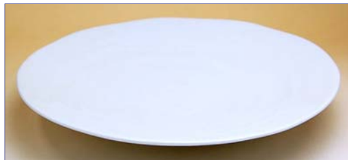
154065 青白釉 30cm 皿 9 4 5 0 円 (本体価格 9 0 0 0 円) (径 30.2×高さ 5.2cm)