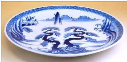
山水 201081 10寸 平皿 (径 30cm) 5 2 5 0 円 (本体価格 5 0 0 0 円) 201082 12寸 平皿 (径 35.8cm) 9 2 4 0 円 (本体価格 8 8 0 0 円) 201083 13寸 平皿 (径 39cm) 1 3 6 5 0 円 (本体価格 1 3 0 0 0 円) 201084 15寸 平皿 (径 45cm) 1 9 9 5 0 円 (本体価格 1 9 0 0 0 円)