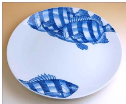
201015 石鯛 10寸平皿 13650円 (径30.5×高さ4cm) (本体価格 13000円)