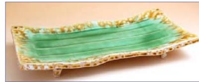
163009 伊良保 長角皿 6 0 9 0 円 (径 14.7×28.8cm) (本体価格 5 8 0 0 円)