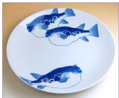
201018 ふぐ 10寸平皿 13650円 (径30.5×高さ4cm) (本体価格 13000円)