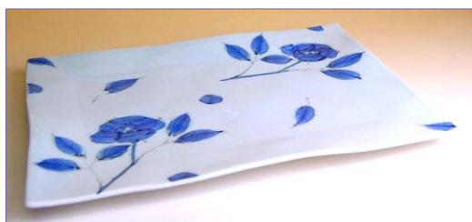
143068 染付バラ 角盛皿 6 8 2 5 円 (本体価格 6 5 0 0 円) (径 32.8×23.6×高さ 2.1cm)