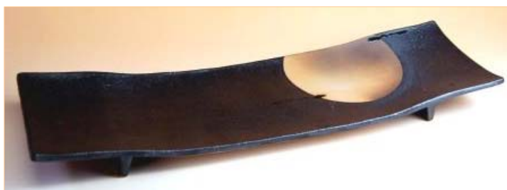
161065 満月 長角大皿 1 2 6 0 0 円 (本体価格 1 2 0 0 0 円) (径 49×15×高さ 5cm)