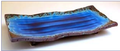
163010 南蛮ルリ 長角皿 6 0 9 0 円 (径 14.7×28.8cm) (本体価格 5 8 0 0 円)