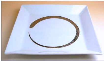
149047 白プラチナ刷毛 額縁尺皿 8 4 0 0 円 (本体価格 8 0 0 0 円) (径 29.2×高さ 3.8cm)