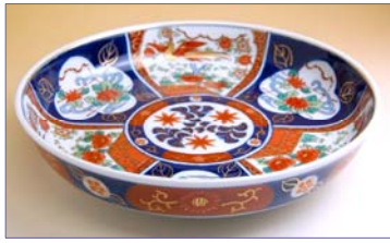
201079 上錦三方割牡丹鳳凰 9寸鉦鉢 (径 27.3cm) 1 5 7 5 0 円 (本体価格 1 5 0 0 0 円)