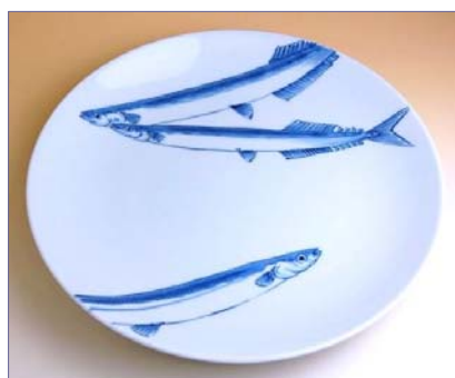
201016 さんま 10寸平皿 13650円 (径30.5×高さ4cm) (本体価格 13000円)