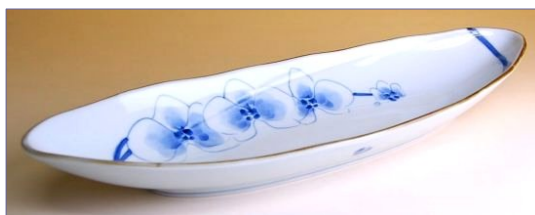
149046 胡蝶蘭 楕円盛鉢 4 4 1 0 円 (本体価格 4 2 0 0 円) (径 40.4×15×高さ 5.2cm)