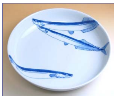
201025 さんま 9寸鉦鉢 1 3 6 5 0 円 (径 27×高さ 6cm) (本体価格 1 3 0 0 0 円)