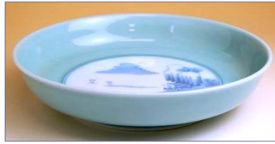
青磁中山水 201074 7寸鉦鉢 (径 21cm) 3 9 9 0 円 (本体価格 3 8 0 0 円) 201075 8寸鉦鉢 (径 24.5cm) 4 7 2 5 円 (本体価格 4 5 0 0 円) 201076 9寸鉦鉢 (径 27.3cm) 6 9 3 0 円 (本体価格 6 6 0 0 円)