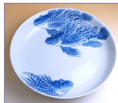
201030 みのかさご 9寸鉦鉢 2 1 0 0 0 円 (径 27×高さ 6cm) (本体価格 2 0 0 0 0 円)