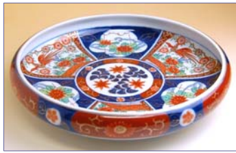
201080 上錦三方割牡丹鳳凰 9寸鉄鉢 (径 27.3cm) 1 6 8 0 0 円 (本体価格 1 6 0 0 0 円)