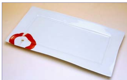
227030 思い花 長角皿 (大) 5 2 5 0 円 (本体価格 5 0 0 0 円) (径 32.5×17.3×高さ 2cm)