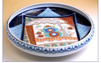
201078 上錦 9寸鉄鉢 (径 27.3cm) 1 6 8 0 0 円 (本体価格 1 6 0 0 0 円)