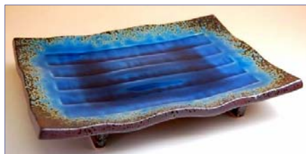
163005 南蛮ルリ (小) 盛皿 1 2 6 0 0 円 (径 22.5×30.7cm) (本体価格 1 2 0 0 0 円) 163006 南蛮ルリ (大) 盛皿 2 5 2 0 0 円 (径 24.7×38.7cm) (本体価格 2 4 0 0 0 円)