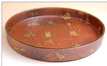
338025 千里 8寸盛鉢 3 7 8 0 円 (本体価格 3 6 0 0 円) (径 24×高さ 3.5cm)