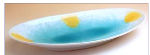
163022 二彩マリンプルー楕円盛皿 5 7 7 5 円 (本体価格 5 5 0 0 円) (径 36.5×18.7×高さ 5cm)