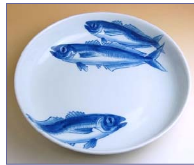
201024 あじ 9寸鉦鉢 1 3 6 5 0 円 (径 27×高さ 6cm) (本体価格 1 3 0 0 0 円)