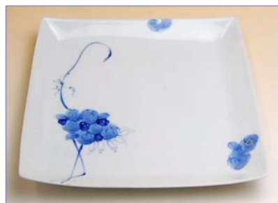
123049 フラミンゴ スクエアプレート (大) 5 0 4 0 円 (本体価格 4 8 0 0 円) (径 21.5cm 角)