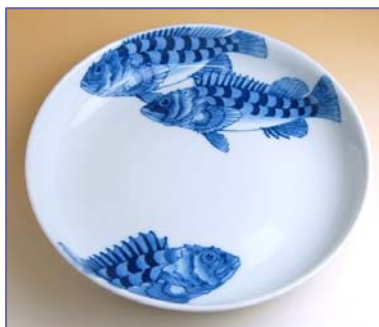
201026 かさご 9寸鉦鉢 1 3 6 5 0 円 (径 27×高さ 6cm) (本体価格 1 3 0 0 0 円)