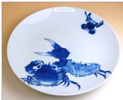
201013 かに 10寸平皿 13650円 (径30.5×高さ4cm) (本体価格 13000円)