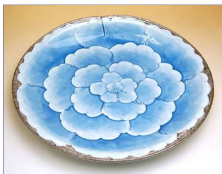
192064 プラチナ牡丹 尺皿 1 0 5 0 0 円 (本体価格 1 0 0 0 0 円) (径 30×高さ 5.1cm)