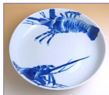
201027 海老 9寸鉦鉢 1 3 6 5 0 円 (径 27×高さ 6cm) (本体価格 1 3 0 0 0 円)