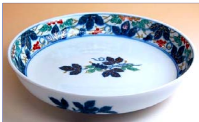
201001 染錦ぶどう 9 寸鉦鉢 1 0 5 0 0 円 (本体価格 1 0 0 0 0 円) (径 27.4×高さ 6cm)