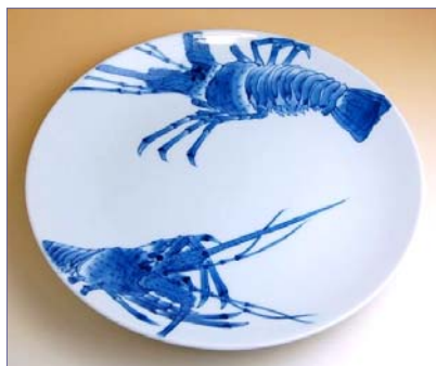
201012 海老 10寸平皿 13650円 (径30.5×高さ4cm) (本体価格 13000円)