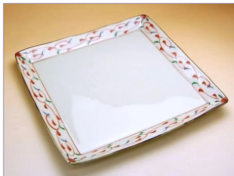
149055 錦唐草 角盛皿 5 7 7 5 円 (本体価格 5 5 0 0 円) (径 28.5cm 角)