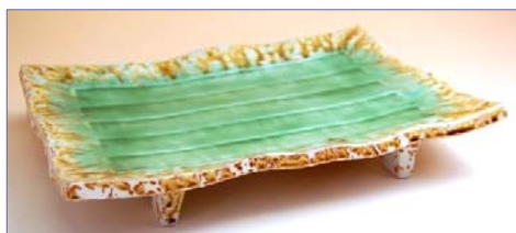
163007 伊良保 (小) 盛皿 1 2 6 0 0 円 (径 22.5×30.7cm) (本体価格 1 2 0 0 0 円) 163008 伊良保 (大) 盛皿 2 5 2 0 0 円 (径 24.7×38.7cm) (本体価格 2 4 0 0 0 円)