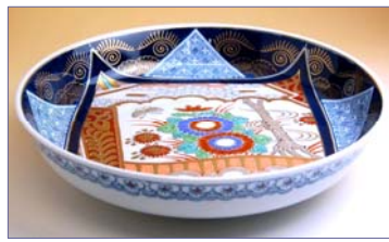
201077 上錦 9寸鉦鉢 (径 27.3cm) 1 6 8 0 0 円 (本体価格 1 6 0 0 0 円)