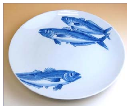
201019 あじ 10寸平皿 13650円 (径30.5×高さ4cm) (本体価格 13000円)