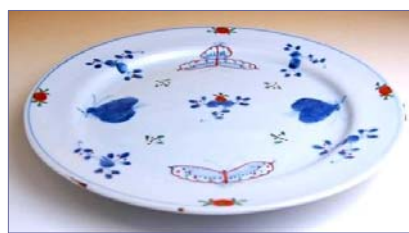
187012 天啓花蝶 5.5寸皿 6 3 0 0 円 (径 16.6cm) (本体価格 6 0 0 0 円) 187014 天啓花蝶 8寸皿 1 1 5 5 0 円 (径 24.5cm) (本体価格 1 1 0 0 0 円)