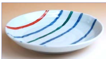
322021 シンプルライン 銘々皿 1 0 5 0 円 (径 14.4cm) (本体価格 1 0 0 0 円)