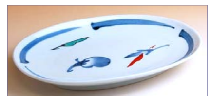
137014 錦なすこしょう 小判焼皿 1 7 8 5 円 (径 20.7×14.3cm) (本体価格 1 7 0 0 円)