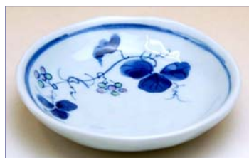
301016 山ぶどう 小皿 1 3 6 5 円 (本体価格 1 3 0 0 円) (径 10.5×高さ 2.3cm)