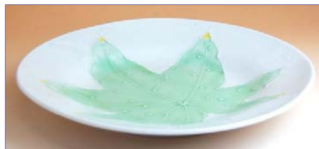
169011 楓香 8寸皿 4 2 0 0 円 (本体価格 4 0 0 0 円) (径 24cm)