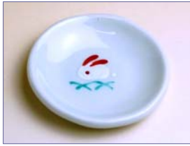
322062 華ぐるま 豆皿 (B) 5 8 8 円 (径 7cm) (本体価格 5 6 0 円)