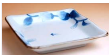
149013 こもれび 角取皿 1 1 5 5 円 (径 13.5cm) (本体価格 1 1 0 0 円)