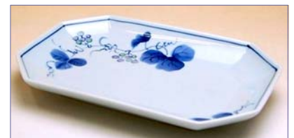
301017 山ぶどう (小) 焼皿 1 5 7 5 円 (本体価格 1 5 0 0 円) (径 17.5×12×高さ 2.4cm)