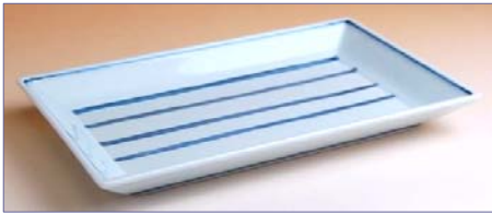
149045 呉須ライン 焼皿 1 2 6 0 円 (径 20×12.3cm) (本体価格 1 2 0 0 円)