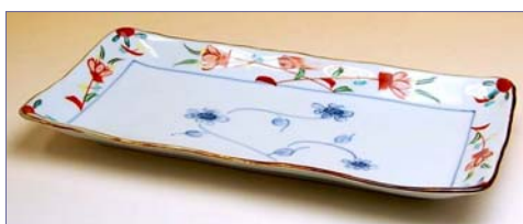
149066 花飾り 焼皿 1 6 8 0 円 (本体価格 1 6 0 0 円) (径 24×12×高さ 2.5cm)