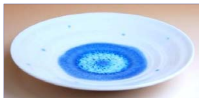
190010 青しずく 取皿 1260円 (径 15cm) (本体価格 1200円)