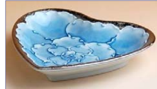
192039 プラチナ牡丹 ハート小皿 2 1 0 0 円 (本体価格 2 0 0 0 円) (径 10.2 cm)