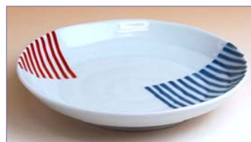
322020 二色ライン 銘々皿 1 0 5 0 円 (径 14.4cm) (本体価格 1 0 0 0 円)