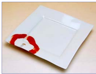
227031 思い花 正角皿 1 8 9 0 円 (本体価格 1 8 0 0 円) (径 15.5×15.2×高さ 2cm)