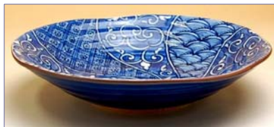
339028 祥瑞 深皿 1 2 6 0 円 (本体価格 1 2 0 0 円) (径 18×高さ 4cm)