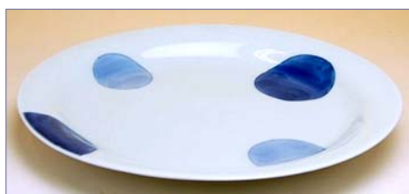
322089 二彩丸紋 (青) 大プレート 2 6 2 5 円 (本体価格 2 5 0 0 円) (径 21.7×高さ 2.5cm)