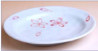
336049 春乃 小皿 7 3 5 円 (径 11.5×9.7cm) (本体価格 7 0 0 円)