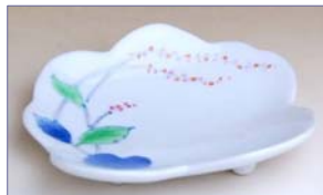
132011 たで絵 変り銘々皿 1 6 8 0 円 (径 11.3×10cm) (本体価格 1 6 0 0 円)