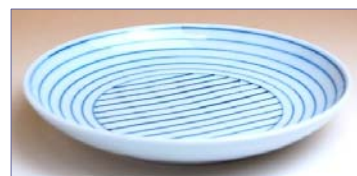
165113 線もよう 5 寸皿 1 6 8 0 円 (径 15cm) (本体価格 1 6 0 0 円)