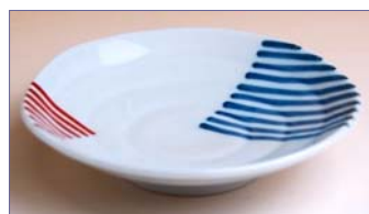
322008 二色ライン 小皿 7 9 8 円 (径 10.5cm) (本体価格 7 6 0 円)