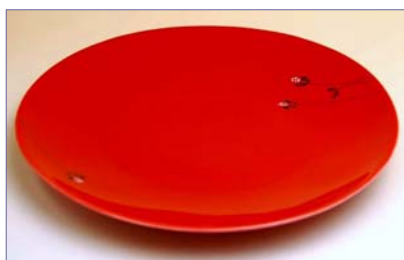
123034 ハニービーンズ (赤) プレート皿 (大) 4 6 2 0 円 (本体価格 4 4 0 0 円) (径 22.7cm)