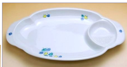
119022 色絵水草 餃子皿 1 8 9 0 円 (本体価格 1 8 0 0 円) (径 29×17×高さ 3.2cm)