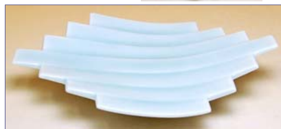
190031 青白磁 浅型中皿 2 1 0 0 円 (本体価格 2 0 0 0 円) (径 16.8×13.9×高さ 2.7cm)