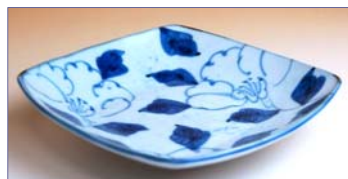
356048 藍花 中皿 1 2 6 0 円 (径 16.7cm) (本体価格 1 2 0 0 円)