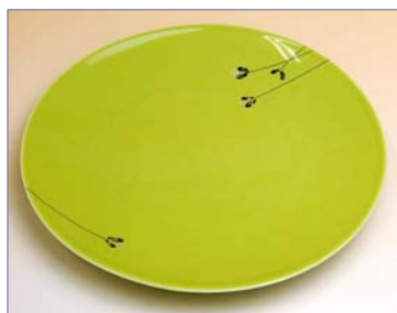
123040 ハニービーンズ (緑) プレート皿 (大) 4 6 2 0 円 (本体価格 4 4 0 0 円) (径 22.7cm)