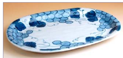
317010 伊万里ぶどう 小判皿 2 4 1 5 円 (径 24.5×17.1cm) (本体価格 2 3 0 0 円)