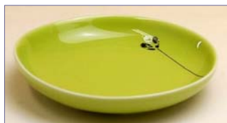
123041 ハニービーンズ (緑) 小皿 1 6 8 0 円 (本体価格 1 6 0 0 円) (径 10cm)