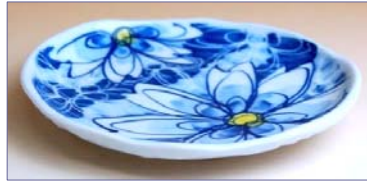
331010 鮮花 小皿 4 6 2 円 (径 12.6×11.5cm) (本体価格 4 4 0 円)