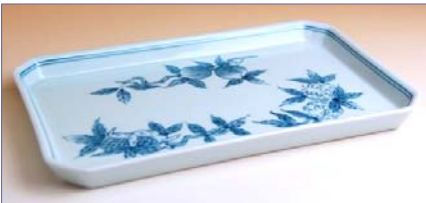
128004 三果紋 焼皿 1 5 7 5 円 (径 22.3×14cm) (本体価格 1 5 0 0 円)