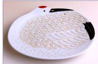
138029 金彩鶴 銘々皿 1 5 7 5 円 (径 12×9.5cm) (本体価格 1 5 0 0 円)