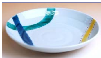
322019 濃つなぎ 銘々皿 1 0 5 0 円 (径 14.4cm) (本体価格 1 0 0 0 円)