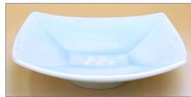
190038 青白磁モザイク 中角皿 3 9 9 0 円 (本体価格 3 8 0 0 円) (径 15.3×高さ 4.3cm)