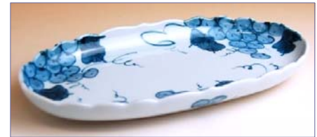
317040 伊万里ぶどう 小判焼皿 1 5 7 5 円 (径 23.2×12cm) (本体価格 1 5 0 0 円)