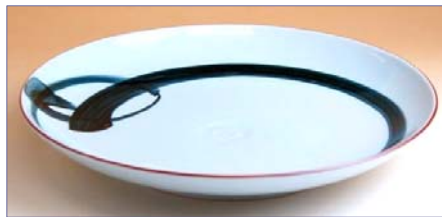
119006 一本締め 8寸皿 1 9 9 5 円 (本体価格 1 9 0 0 円) (径 24.6cm)