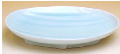
190032 青白磁名水 中皿 2 1 0 0 円 (本体価格 2 0 0 0 円) (径 17.4×12.7×高さ 3cm)