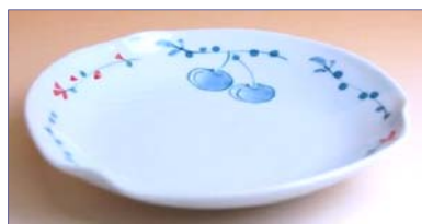
317081 潤唐草さくらんぼ 5寸皿 840円 (径 15.4cm) (本体価格 800円)