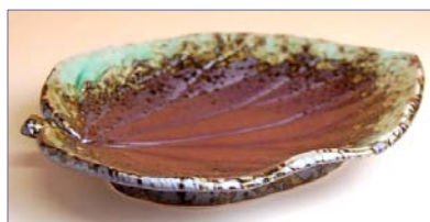
163053 南蛮緑釉流し 葉型皿 1 9 9 5 円 (径 20.5×16×高 3.5cm) (本体価格 1 9 0 0 円)