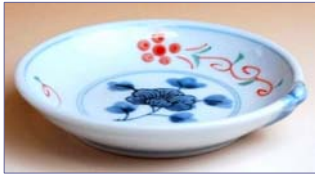
317087 なごみ 小皿 5 4 6 円 (径 9cm) (本体価格 5 2 0 円)