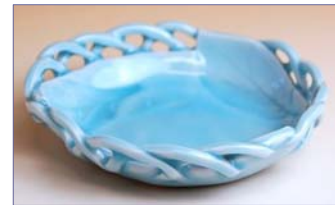
148005 青白磁木の葉 小皿 1 4 7 0 円 (径 11cm) (本体価格 1 4 0 0 円)