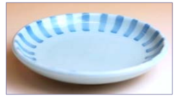
149002 十草 小皿 6 9 3 円 (径 10.1cm) (本体価格 6 6 0 円)