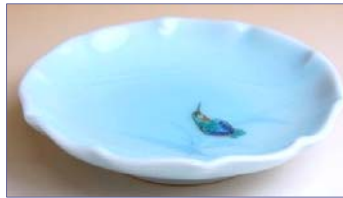
154009 青白磁かわせみ 小皿 1 0 5 0 円 (径 10.9cm) (本体価格 1 0 0 0 円)