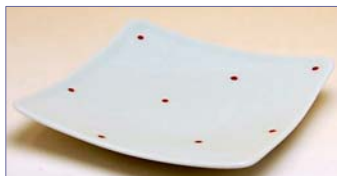
322105 水玉模様 (赤) 角小皿 8 4 0 円 (本体価格 8 0 0 円) (径 10.5cm 角)