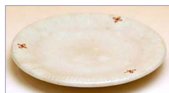
354118 花の香り (赤) 銘々皿 1 3 6 5 円 (本体価格 1 3 0 0 円) (径 12.5×高さ 1.5cm)