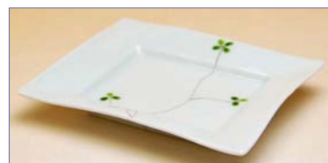
227009 クローバー 角小皿 1 0 5 0 円 (本体価格 1 0 0 0 円) (径 12.5×10×高さ 1.7cm)