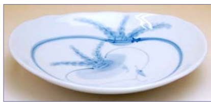
349184 かぶ絵 多用皿 1 4 7 0 円 (本体価格 1 4 0 0 円) (径 18×15×高さ 3.6cm)