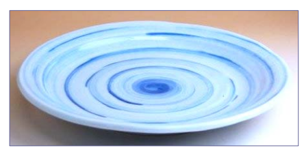
318059 清流 8寸皿 2 4 1 5 円 (本体価格 2 3 0 0 円) (径 24.8cm)