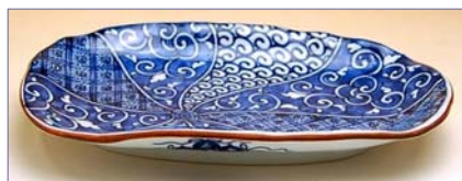
339026 祥瑞 変り角皿 1 2 6 0 円 (本体価格 1 2 0 0 円) (径 21.4×13.3×高さ 3cm)