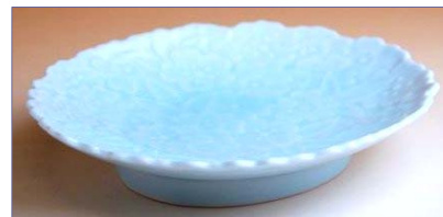
154005 青白磁桜花 銘々皿 1365円 (径 15.5×13.3cm) (本体価格 1300円)