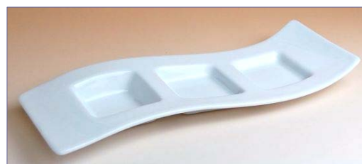
154036 白磁 ウェーブ三品盛 2 7 3 0 円 (本体価格 2 6 0 0 円) (径 26.5×9.2×高さ 2.3cm)