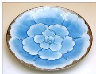
192066 プラチナ牡丹 ケーキ皿 3 3 6 0 円 (本体価格 3 2 0 0 円) (径 18.3×高さ 2.7cm)