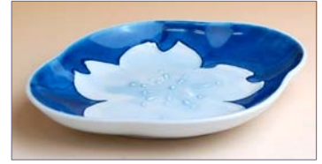
317099 藍桜香 銘々皿 1 0 5 0 円 (径 13×10.2cm) (本体価格 1 0 0 0 円)