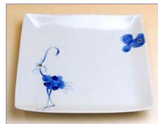
123050 フラミンゴ スクエアープレート (小) 2 5 2 0 円 (本体価格 2 4 0 0 円) (15.5cm 角)