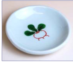
322065 華ぐるま 豆皿 (E) 5 8 8 円 (径 7cm) (本体価格 5 6 0 円)