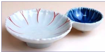
172052 染朱 花型二品皿 1 5 7 5 円 (径 11.3×7cm) (本体価格 1 5 0 0 円)