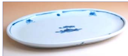
165021 小花 楕円平皿 2 3 1 0 円 (径 23.7×14.3cm) (本体価格 2 2 0 0 円)