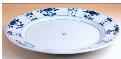
165057 芙蓉手 7.5 寸皿 4 2 0 0 円 (本体価格 4 0 0 0 円) (径 23cm)