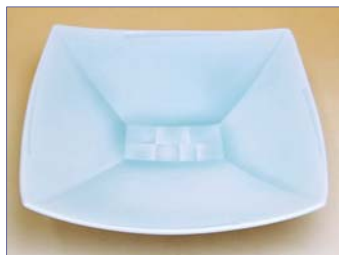
190037 青白磁モザイク 大角皿 5 2 5 0 円 (本体価格 5 0 0 0 円) (径 18.7×高さ 4.8cm)