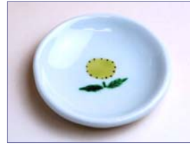
322070 華ぐるま 豆皿 (J) 5 8 8 円 (径 7cm) (本体価格 5 6 0 円)