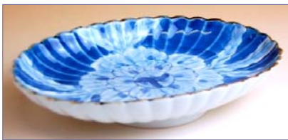
149026 濃牡丹 菊型皿 1 4 7 0 円 (径 19×12.4cm) (本体価格 1 4 0 0 円)