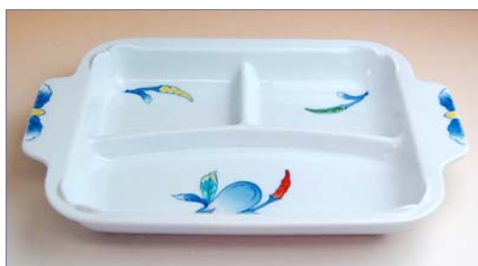
119020 染錦野菜 仕切りプレート 2 9 4 0 円 (本体価格 2 8 0 0 円) (径 25.2×18×高さ 3.8 cm)