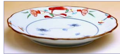
149058 花飾り 6寸皿 1 6 8 0 円 (本体価格 1 6 0 0 円) (径 18.5×高さ 2.8cm)