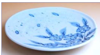
356042 花吹雪 丸取皿 8 4 0 円 (径 16cm) (本体価格 8 0 0 円)