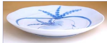
349167 かぶ絵 なぶり 8寸皿 2 8 3 5 円 (本体価格 2 7 0 0 円) (径 24.7×高さ 4.2cm)