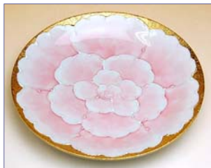
192067 金濃ピンク牡丹 ケーキ皿 3 3 6 0 円 (本体価格 3 2 0 0 円) (径 18.3×高さ 2.7cm)