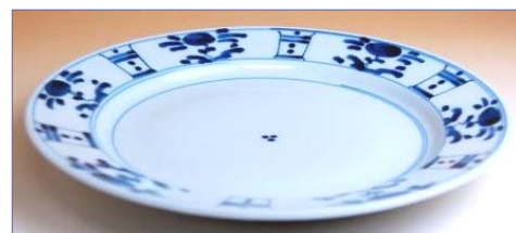
165058 芙蓉手 8.5 寸皿 6 3 0 0 円 (本体価格 6 0 0 0 円) (径 27cm)