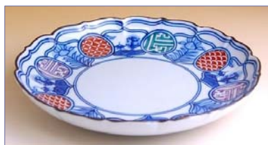
197007 色絵丸紋山水 6 寸皿 5 7 7 5 円 (径 18.6cm) (本体価格 5 5 0 0 円)