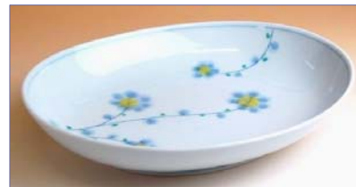
119012 早風花 (黄) パスタ皿 1 8 9 0 円 (本体価格 1 8 0 0 円) (径 23.3×18.9×高さ 4.5cm)