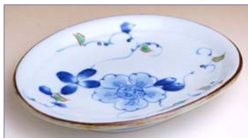
149015 染錦花牡丹 楕円取皿 1155円 (径 14.7×11.7cm) (本体価格 1100円)