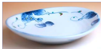
317044 姫りんご 取皿 1 1 5 5 円 (径 16.3×15cm) (本体価格 1 1 0 0 円)