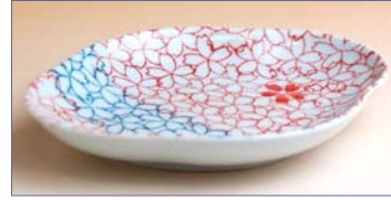
317105 桜小町 銘々皿 8 4 0 円 (径 13×10.2cm) (本体価格 8 0 0 円)