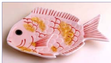
138028 さくら鯛 銘々皿 1 5 7 5 円 (径 13.5×9.1cm) (本体価格 1 5 0 0 円)