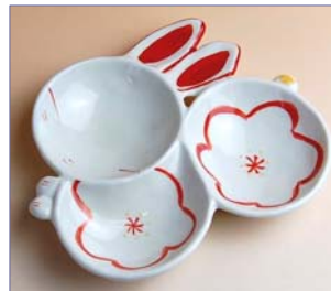
136032 朱花うさぎ 三品皿 2 4 1 5 円 (本体価格 2 3 0 0 円) (径 14.5×11.8×高さ 2.4 cm)