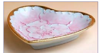
192038 金濃ピンク牡丹 ハート小皿 2 1 0 0 円 (本体価格 2 0 0 0 円) (径 10.2 cm)