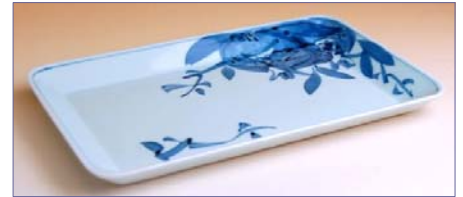
317021 染付ざくろ 焼皿 1 2 6 0 円 (径 21.5×13.2cm) (本体価格 1 2 0 0 円)