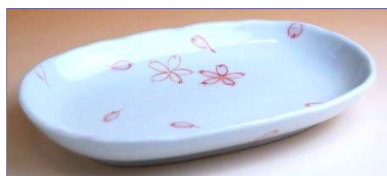
336048 春乃 小判中皿 1365円 (径 18.8×12.8cm) (本体価格 1300円)