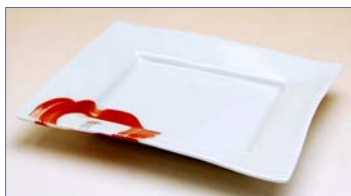
227038 思い花 角小皿 1 0 5 0 円 (本体価格 1 0 0 0 円) (径 12.5×10×高さ 1.7cm)