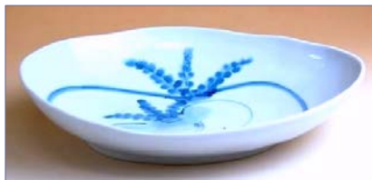
349169 かぶ絵 パスタ皿 2 3 1 0 円 (本体価格 2 2 0 0 円) (径 22×18×高さ 4.7cm)