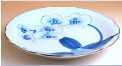
149023 胡蝶蘭 7寸皿 1 9 9 5 円 (本体価格 1 9 0 0 円) (径 21.2cm)