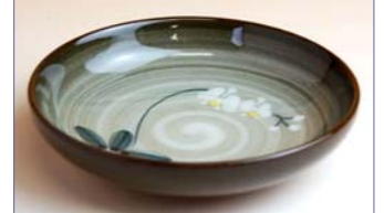
102031 胡蝶蘭 小皿 1 4 7 0 円 (径 10cm) (本体価格 1 4 0 0 円)