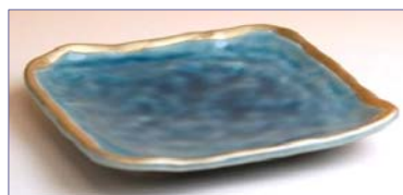
172016 青藍淵金 4.5 寸皿 2 1 0 0 円 (径 10.9×12.3cm) (本体価格 2 0 0 0 円)