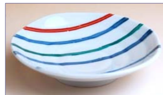
322009 シンプルライン 小皿 7 9 8 円 (径 10.5cm) (本体価格 7 6 0 円)