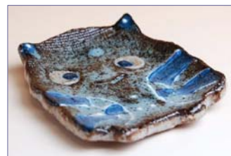
314004 ふくろう 小皿 9 4 5 円 (本体価格 9 0 0 円) (径 8×幅 7.5cm)