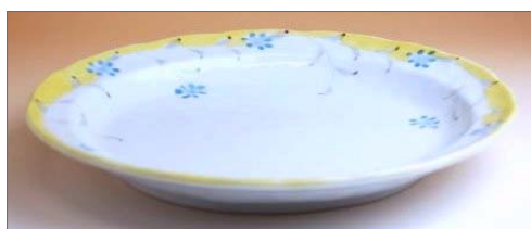
336045 京香 大皿 3 3 6 0 円 (本体価格 3 2 0 0 円) (径 25.5×23.5cm)