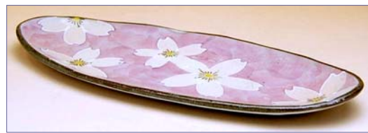
302070 花織 銘々皿 1 6 8 0 円 (本体価格 1 6 0 0 円) (径 22.3×9.2×高さ 1.7cm)