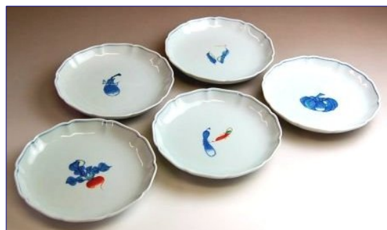
136018 絵変り根菜 小皿揃 5 7 7 5 円 (径 10.4cm) (本体価格 5 5 0 0 円)