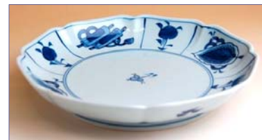
317030 古染巻物 6 寸皿 1 4 7 0 円 (径 19cm) (本体価格 1 4 0 0 円)