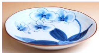
149020 胡蝶蘭 取皿 1 1 5 5 円 (径 14.5cm) (本体価格 1 1 0 0 円)