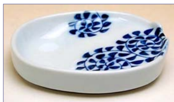
307018 たこ唐草 醤油小皿 7 3 5 円 (本体価格 7 0 0 円) (径 10.7×9.4×高さ 2.3cm)