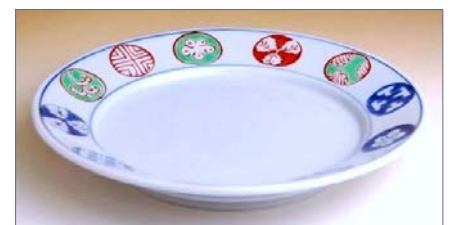
187021 染錦丸紋 5.5寸皿 5 6 7 0 円 (径 16.6cm) (本体価格 5 4 0 0 円) 187022 染錦丸紋 6.5寸皿 6 3 0 0 円 (径 19.7cm) (本体価格 6 0 0 0 円) 187019 染錦丸紋 8寸皿 9 4 5 0 円 (径 24.5cm) (本体価格 9 0 0 0 円)