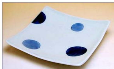
322118 二彩丸紋 (青) 角皿 1 4 7 0 円 (本体価格 1 4 0 0 円) (14.8cm 角)