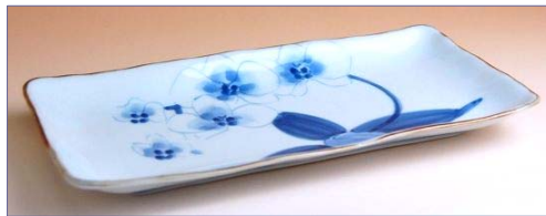
149022 胡蝶蘭 焼皿 1 3 6 5 円 (径 24×12cm) (本体価格 1 3 0 0 円)