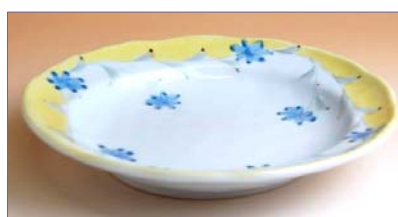
336046 京香 中皿 1575円 (径 17.5×16.5cm) (本体価格 1500円)