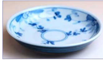
334028 たちばな 小皿 6 3 0 円 (径 10.5cm) (本体価格 6 0 0 円)