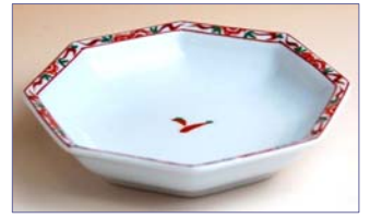
343005 錦万暦 八角小皿 5 2 5 円 (径 9.7cm) (本体価格 5 0 0 円)