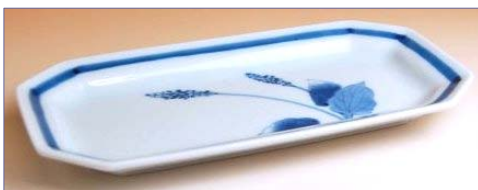
168004 おおばこ絵 焼皿 2 9 4 0 円 (径 23.5×12cm) (本体価格 2 8 0 0 円)