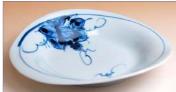
316016 ぶどう 変わり銘々皿 8 4 0 円 (径 15.5cm) (本体価格 8 0 0 円)