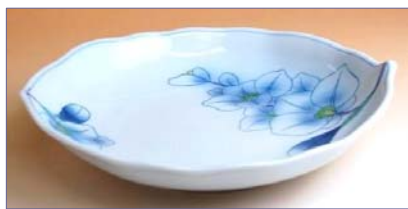
119013 蘭の花 多用皿 1 4 7 0 円 (本体価格 1 4 0 0 円) (径 20.3×18.3×高さ 4.3cm)