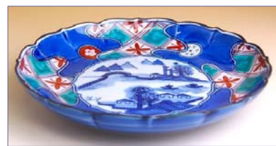
197008 地紋捨り山水 6 寸皿 5 7 7 5 円 (径 18.6cm) (本体価格 5 5 0 0 円)