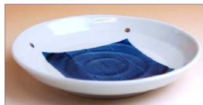
322022 角紋 銘々皿 1 0 5 0 円 (径 14.4cm) (本体価格 1 0 0 0 円)