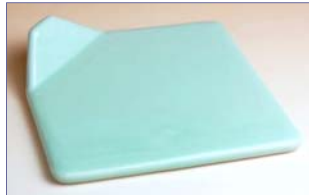
139006 青磁クリーム 板皿 1 2 6 0 円 (本体価格 1 2 0 0 円) (径 11×高さ 2.3cm)