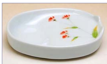
307017 花静 醤油小皿 7 3 5 円 (本体価格 7 0 0 円) (径 10.7×9.4×高さ 2.3cm)