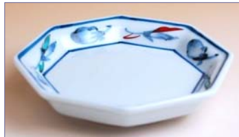
137013 錦なすこしょう 八角小皿 9 4 5 円 (径 10.4cm) (本体価格 9 0 0 円)