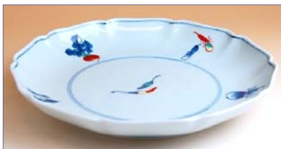
136002 根菜 7寸皿 4 2 0 0 円 (本体価格 4 0 0 0 円) (径 21cm)