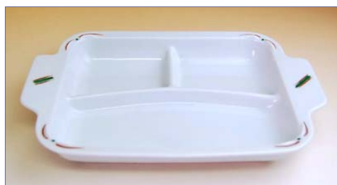
119021 芽立ち 仕切りプレート 2 5 2 0 円 (本体価格 2 4 0 0 円) (径 25.2×18×高さ 3.8 cm)