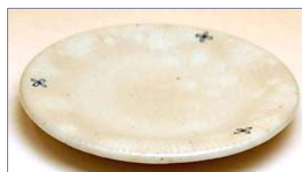
354117 花の香り (青) 銘々皿 1 3 6 5 円 (本体価格 1 3 0 0 円) (径 12.5×高さ 1.5cm)