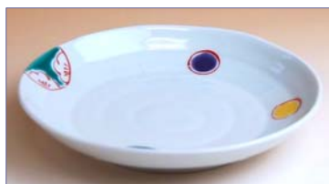
322018 花丸紋 銘々皿 1 0 5 0 円 (径 14.4cm) (本体価格 1 0 0 0 円)