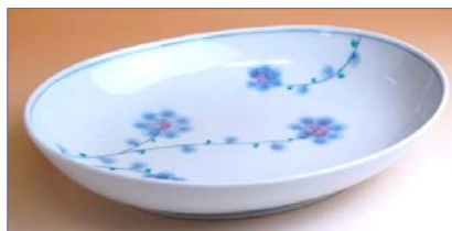
119011 早風花 (紫) パスタ皿 1 8 9 0 円 (本体価格 1 8 0 0 円) (径 23.3×18.9×高さ 4.5cm)