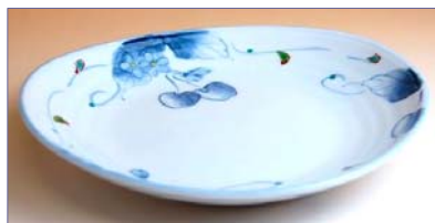
317046 姫りんご 多用皿 1 7 8 5 円 (径 20.4×18.8cm) (本体価格 1 7 0 0 円)