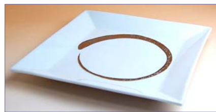
149054 白プラチナ刷毛 額淵 8 寸皿 5 0 4 0 円 (本体価格 4 8 0 0 円) (径 22.5 cm 角)