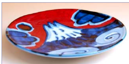
356034 富士山 取皿 1 2 6 0 円 (径 16cm) (本体価格 1 2 0 0 円)