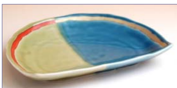
172011 遊調掛分 半月 4 寸皿 2 1 0 0 円 (径 9.1×11.9cm) (本体価格 2 0 0 0 円)