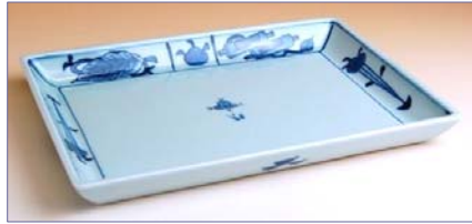
317037 古染巻物 焼皿 1 3 6 5 円 (径 21×14.5cm) (本体価格 1 3 0 0 円)