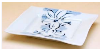
227021 花紋帯 角小皿 1 0 5 0 円 (本体価格 1 0 0 0 円) (径 12.5×10×高さ 1.7cm)