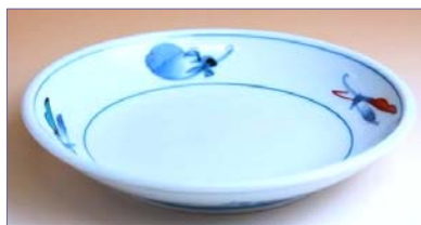
137015 錦なすこしょう 5寸皿 1365円 (径 15.5cm) (本体価格 1300円)