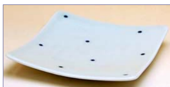
322104 水玉模様 (青) 角小皿 8 4 0 円 (本体価格 8 0 0 円) (径 10.5cm 角)