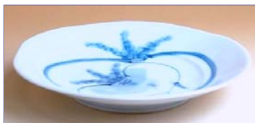
349165 かぶ絵 なぶり 5 寸皿 1 2 6 0 円 (径 16cm) (本体価格 1 2 0 0 円)