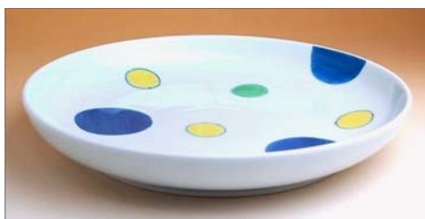
168044 染錦水玉紋 8寸深皿 5 2 5 0 円 (本体価格 5 0 0 0 円) (径 24.8cm)