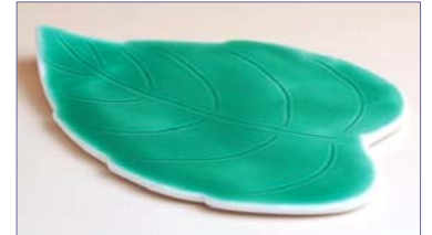
132018 グリーン葉型 銘々皿 1 6 8 0 円 (径 11.6×8.4cm) (本体価格 1 6 0 0 円)