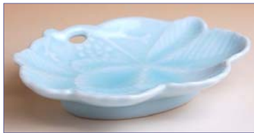
154010 青白磁ぶどう 小皿 1 1 5 5 円 (径 12.1×8.4cm) (本体価格 1 1 0 0 円)