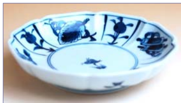
317034 古染巻物 小皿 7 9 8 円 (径 11cm) (本体価格 7 6 0 円)