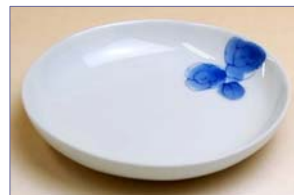
123046 フラミンゴ 小皿 1 6 8 0 円 (本体価格 1 6 0 0 円) (径 10cm)