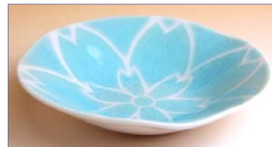
163015 水色釉彩 多用皿 1680円 (径 14.7cm) (本体価格 1600円)