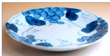
317041 伊万里ぶどう 6 寸皿 1 5 1 2 円 (径 18.5cm) (本体価格 1 4 4 0 円)