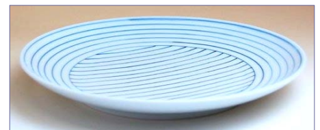
165114 線もよう 7寸皿 2 8 3 5 円 (本体価格 2 7 0 0 円) (径 22.6cm)