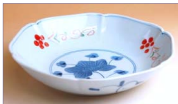
317086 なごみ 深皿 1 6 8 0 円 (本体価格 1 6 0 0 円) (径 18.2×高さ 4.2cm)