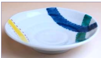
322007 濃つなぎ 小皿 7 9 8 円 (径 10.5cm) (本体価格 7 6 0 円)