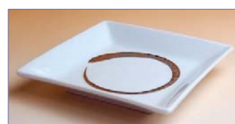
149053 白プラチナ刷毛 額淵 4 寸皿 1 6 8 0 円 (本体価格 1 6 0 0 円) (径 11.6 cm 角)