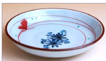
334010 野菊 小皿 7 3 5 円 (本体価格 7 0 0 円) (径 10.5cm)