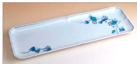
119015 紫小花 帯皿 2 6 2 5 円 (本体価格 2 5 0 0 円) (径 35×11.5cm)