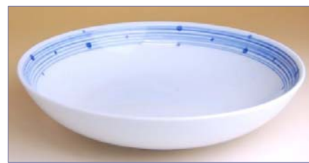
112008 玉縞 7 寸深皿 2 6 2 5 円 (径 20×高さ 4.5cm) (本体価格 2 5 0 0 円)