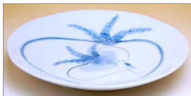
349183 かぶ絵 なぶり 6.5 寸皿 2 1 0 0 円 (本体価格 2 0 0 0 円) (径 20×高さ 3.2cm)