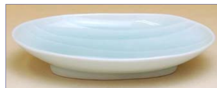
190033 青白磁名水 小皿 1 3 6 5 円 (本体価格 1 3 0 0 円) (径 13.7×9×高さ 2.3cm)