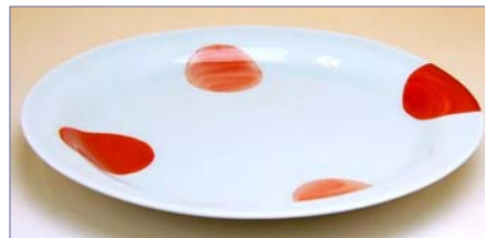
322090 二彩丸紋 (赤) 大プレート 2 6 2 5 円 (本体価格 2 5 0 0 円) (径 21.7×高さ 2.5cm)