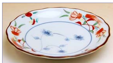
149060 花飾り 取皿 1 4 7 0 円 (本体価格 1 4 0 0 円) (径 15.3×高さ 2.5cm)