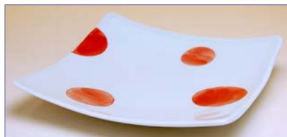
322119 二彩丸紋 (赤) 角皿 1 4 7 0 円 (本体価格 1 4 0 0 円) (14.8cm 角)