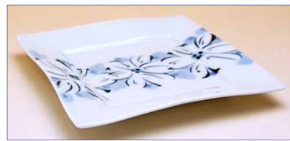
227019 花紋帯 正角皿 1 8 9 0 円 (本体価格 1 8 0 0 円) (径 15.5×15.2×高さ 2cm)