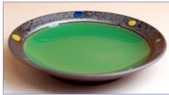
318014 緑釉点彩 小皿 1 1 5 5 円 (径 10.5cm) (本体価格 1 1 0 0 円)