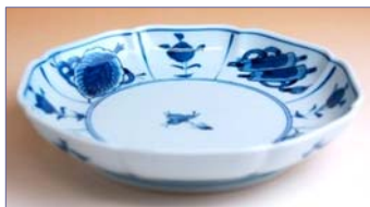
317035 古染巻物 5 寸皿 1 0 0 8 円 (径 14.8cm) (本体価格 9 6 0 円)