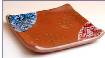
338007 焼〆地紋 銘々皿 1 1 5 5 円 (径 10.4cm) (本体価格 1 1 0 0 円)