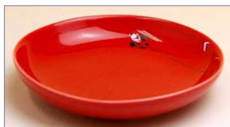
123035 ハニービーンズ (赤) 小皿 1 6 8 0 円 (本体価格 1 6 0 0 円) (径 10cm)