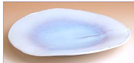
190003 紫織 銘々皿 1260円 (径 17.3×15.5cm) (本体価格 1200円)