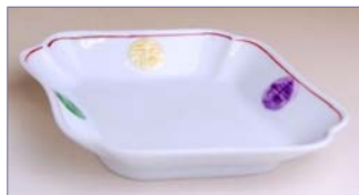
132010 福寿交趾 菱形銘々皿 1 6 8 0 円 (径 13.4×11cm) (本体価格 1 6 0 0 円)