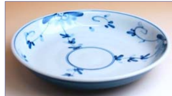
334027 たちばな 5 寸皿 1 0 5 0 円 (径 15cm) (本体価格 1 0 0 0 円)