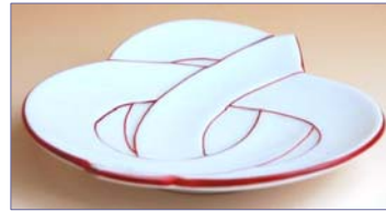
164010 朱線むすび 銘々皿 1 5 5 4 円 (径 11cm) (本体価格 1 4 8 0 円)