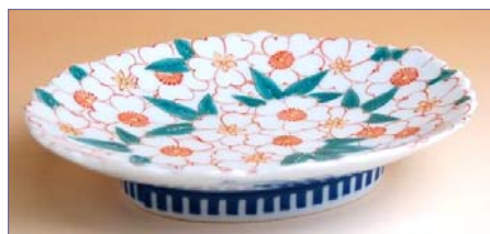
154006 錦桜花 銘々皿 4830円 (径 15.5×13.3cm) (本体価格 4600円)