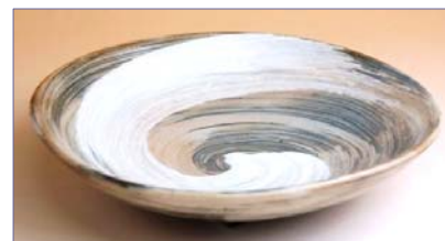
338040 飛鳥 (中) 三角皿 1680円 (径 17cm) (本体価格 1600円)