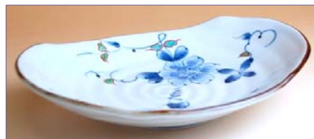
149017 染錦花牡丹 変和皿 1 7 8 5 円 (径 21×15.5cm) (本体価格 1 7 0 0 円)