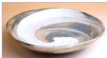
338039 飛鳥 (小) 三角皿 1155円 (径 13.7cm) (本体価格 1100円)