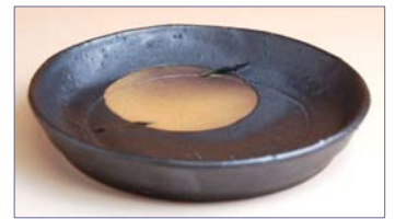
161063 お月見 小皿 1 1 5 5 円 (径 10cm) (本体価格 1 1 0 0 円)