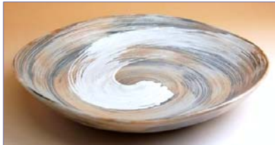
338041 飛鳥 (大) 三角皿 3 6 7 5 円 (本体価格 3 5 0 0 円) (径 25cm)