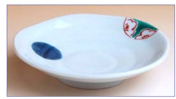
322006 花丸紋 小皿 7 9 8 円 (径 10.5cm) (本体価格 7 6 0 円)