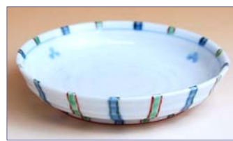
336063 掬十草 小皿 7 3 5 円 (径 10.9cm) (本体価格 7 0 0 円)