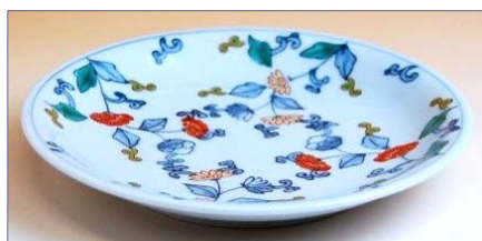
335007 花しらべ 5寸皿 2310円 (径 16.4cm) (本体価格 2200円)