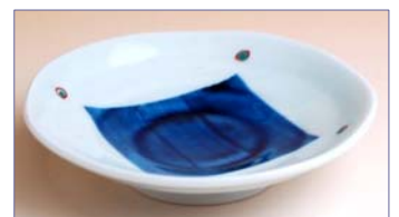
322010 角紋 小皿 7 9 8 円 (径 10.5cm) (本体価格 7 6 0 円)